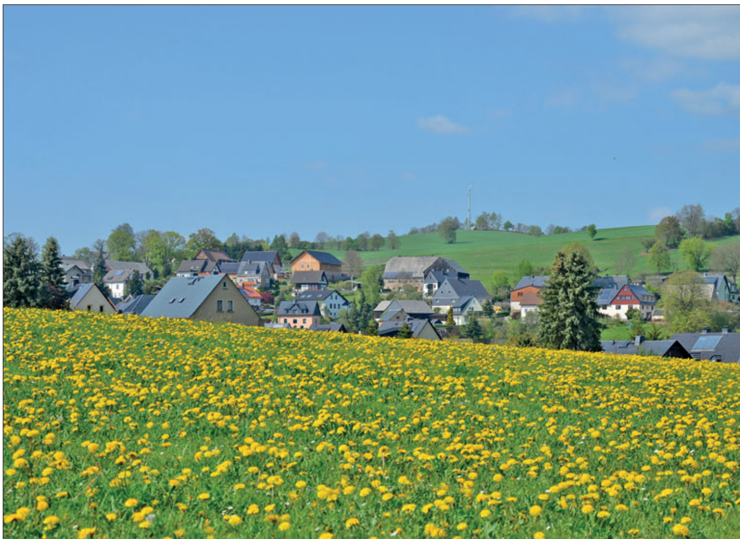
Blick auf Griebach

MIT DEN ORTSTEILEN: DREBACH, VENUSBERG, SCHARFENSTEIN, GRIESSBACH, SPINNEREI, WILSCHTHAL, WILTZSCH UND IM GRUND