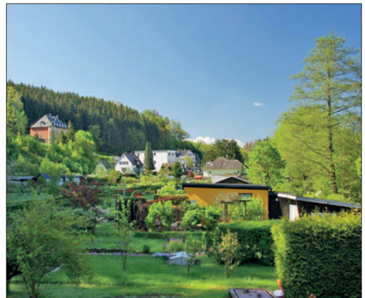
Gartenanlage im Ortsteil Wiltzsch

Per Kontaktformular unter www.sternwarte-drebach.de , WhatsApp: 01525/1605375 oder Tel. 037341/7435