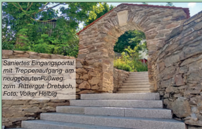
Saniertes Eingangsportale mit Treppenaufgang am neugebauten Fußweg zum Rittergut Drebach