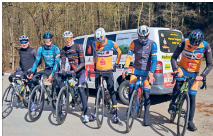
Trainingslager JHB Hornersdorf

Ein Dankeschön der Besatzung der JHB Hornersdorf, die wie immer beste Bedingungen für ein erfolgreiches Gelingen boten!