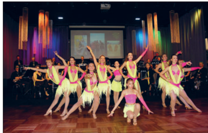
Brass and Dance am 25.10.25

Ein wichtiger Part in unserem Verein sind außerdem die Heegilegs. Eine Gruppe tanzbegeisterter Mädchen und junger Frauen, die mit ihren Choreografien immer wieder begeistern. Einer der Höhepunkte in diesem Jahr war mit Sicherheit die Veranstaltung „Brass and Dance“ im Volkshaus Thum am 25.10.2025. Brass 94, ein Ensemble des Jugendblasorchesters Thum, blickte zurück auf eine ereignisreiche Brasilien-Konzert-Reise und lud die Heegilegs zum wiederholten Male ein, den Abend durch Tanzauftritte zu bereichern. Da durfte natürlich die Samba nicht fehlen, welcher durch atemberaubende Kostüme, lässigen Hüftschwung und beeindruckende Akrobatik dargeboten und kräftig bejubelt wurde. Ein tolles Event, das auch 2026 seine Fortsetzung finden soll.