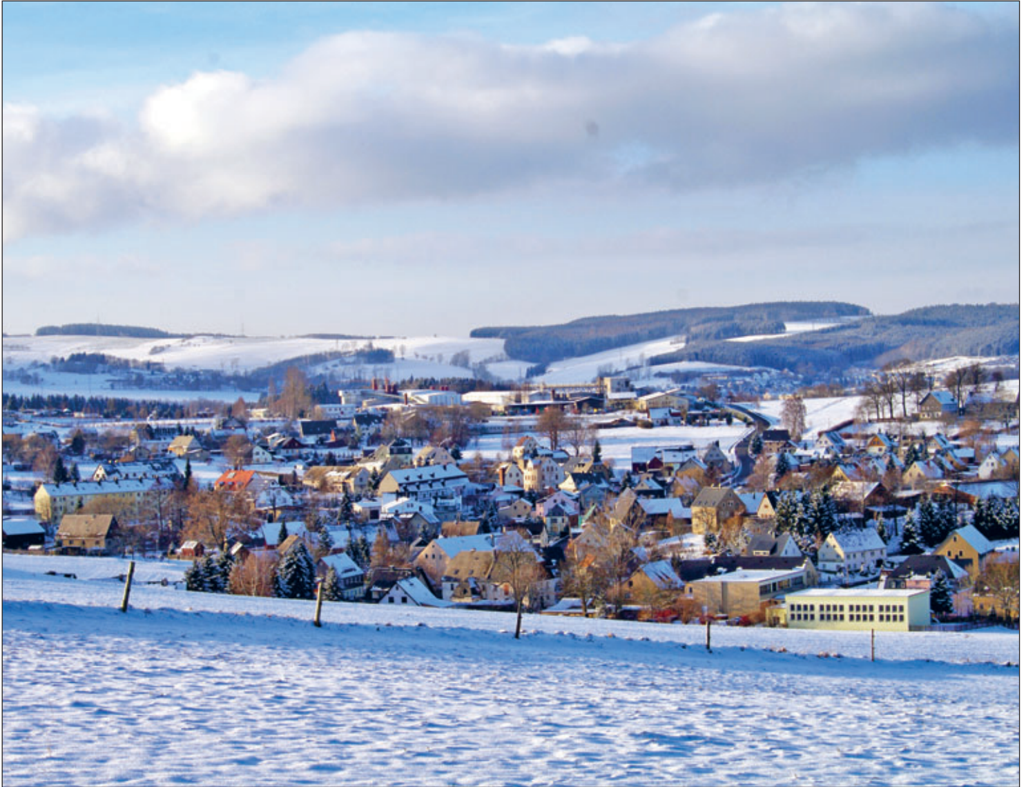
Blick auf Venusberg

mit den Ortsteilen: Drebach, Venusberg, Scharfenstein, Griebbach, Spinnerei, Wilischthal, Wiltzsch und Im Grund