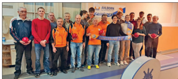
traditionelle RSV-Kegelveranstaltung am Jahresende