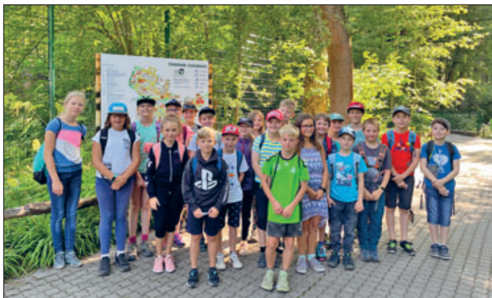
Das Team der GS Venusberg

Ein besonderer Dank geht an alle großen und kleinen Helfer, die uns bei der Vorbereitung und Durchführung aller Aktivitäten tatkräftig unterstützt haben.