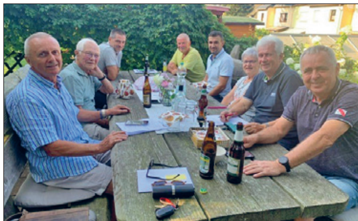
Beratung der Wegewarte am 20.08.2024