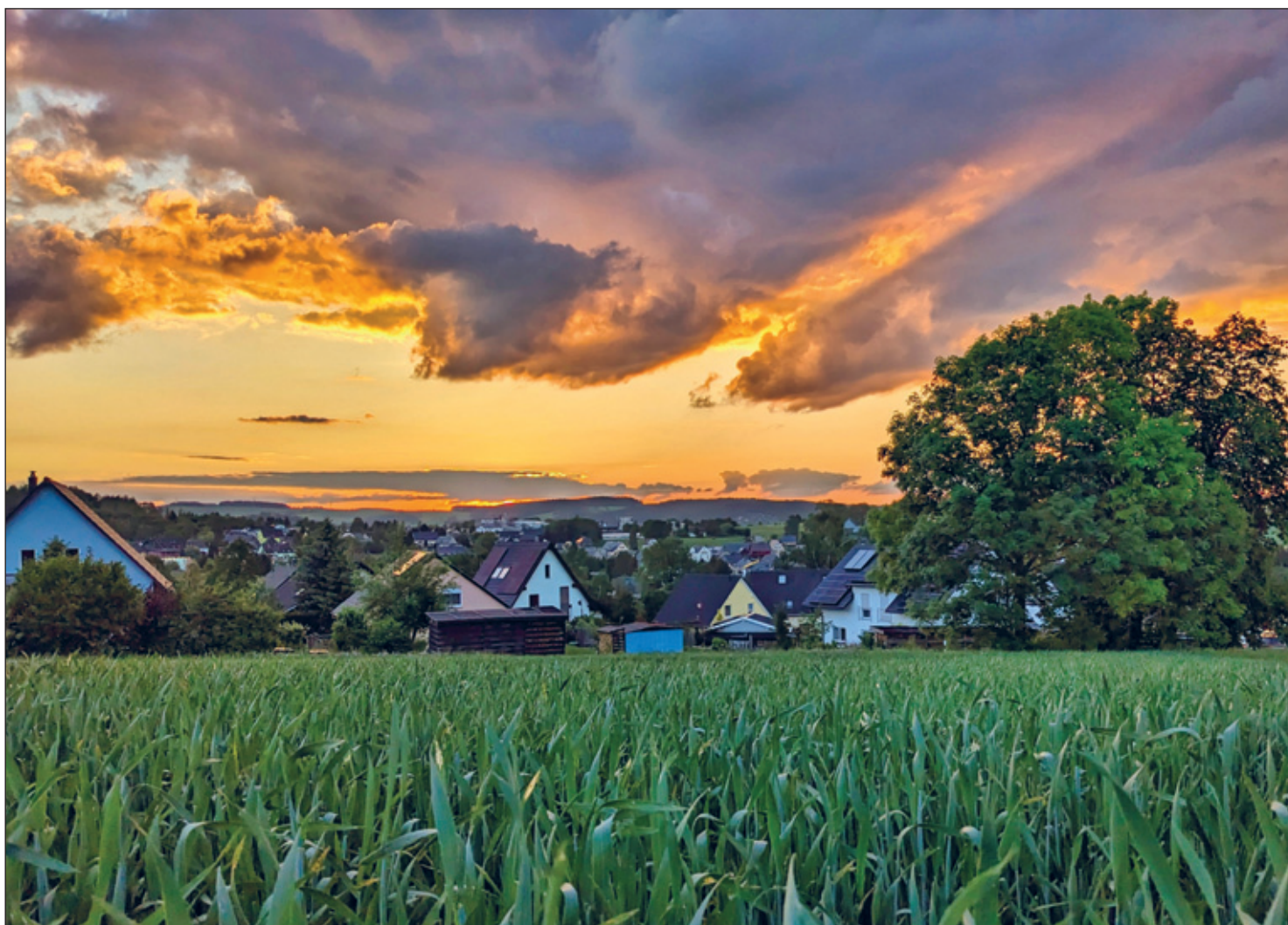
Blick auf den Erlengrund im Ortsteil Venusberg

MIT DEN ORTSTEILEN: DREBACH, VENUSBERG, SCHARFENSTEIN, GRIESSBACH, SPINNEREI, WILISCHTHAL, WILTZSCH UND IM GRUND