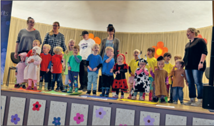
Auftritt der „Getzenknirpse“ zur Seniorengeburtsfeier am 13. September 2024 im Gasthof Griebbach