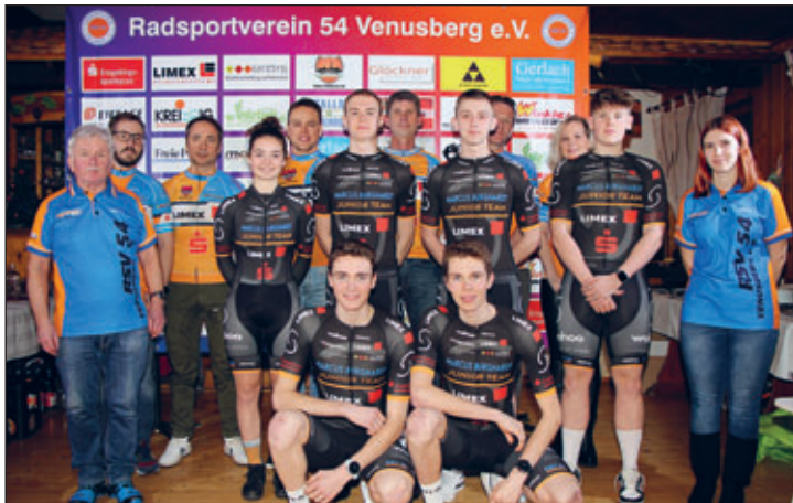
Erfolgreiche RSV-Mannschaft von 2023 (es fehlt der Weltmeister Colin Rudolph)