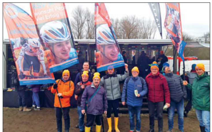
RSV 54 - Abordnung bei der Cross-WM