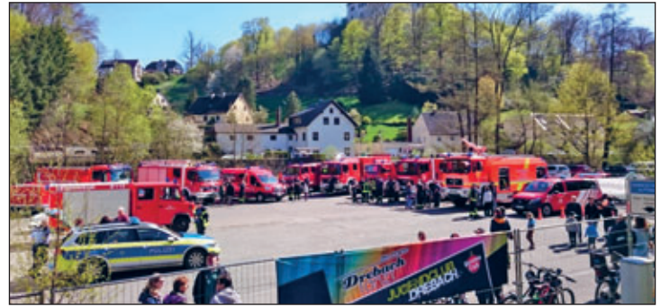
Technik-Schau der Gemeindefeuerwehren am 30.04.2023