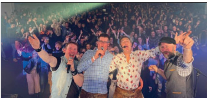
Party im Festzelt mit Aischzeit

Da das Wochenende ein solch gutes Echo bekommen hat, wird seitens der Veranstalter eine Wiederholung nicht ausgeschlossen.