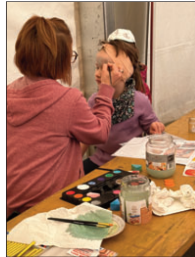
Kinderschminken am 30.04.2023