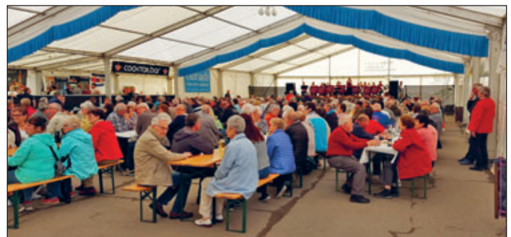
Auftritt der Heidelbachtal Musikanten am 01.05.2023