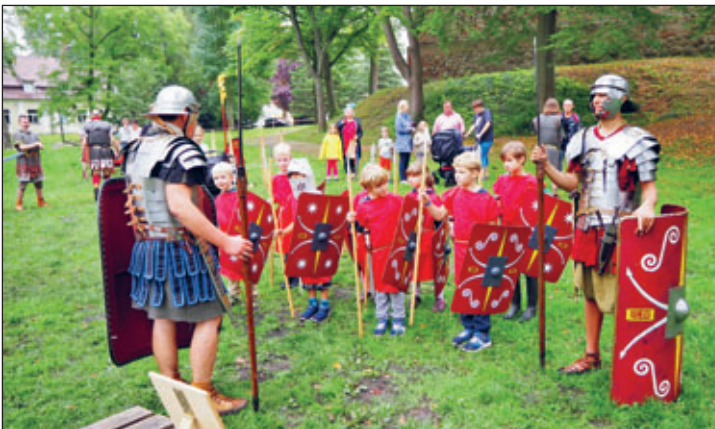
Kinder können beim Römer-Sommerfest sogar eine kleine Legionärs-Ausbildung ablegen.

4. Juni | 13 + 15 Uhr Burgführung – Eine sagenhafte Führung durch das Mittelalter Tickets: 8 € Erw. / 6 € erm. / 21 € Fam., Tickets online erhältlich.