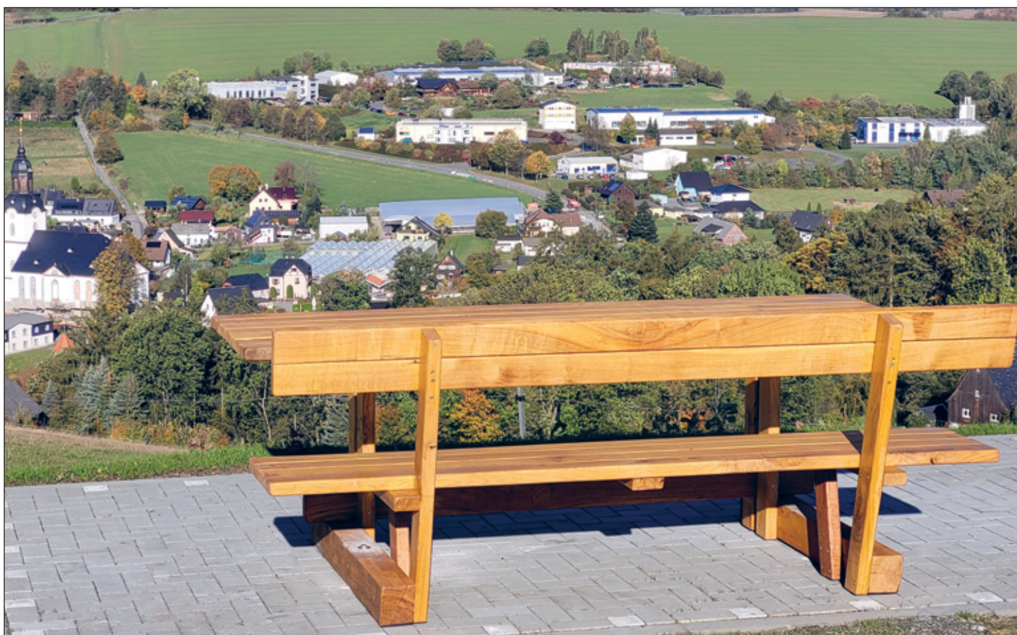
Neue Sitzgruppe beim „Pfarrgutbüschelweg“ mit Blick auf Niederdrebach

MIT DEN ORTSTEILEN: DREBACH, VENUSBERG, SCHARFENSTEIN, GRIESSBACH, SPINNEREI, WILISCHTHAL, WILTZSCH UND IM GRUND