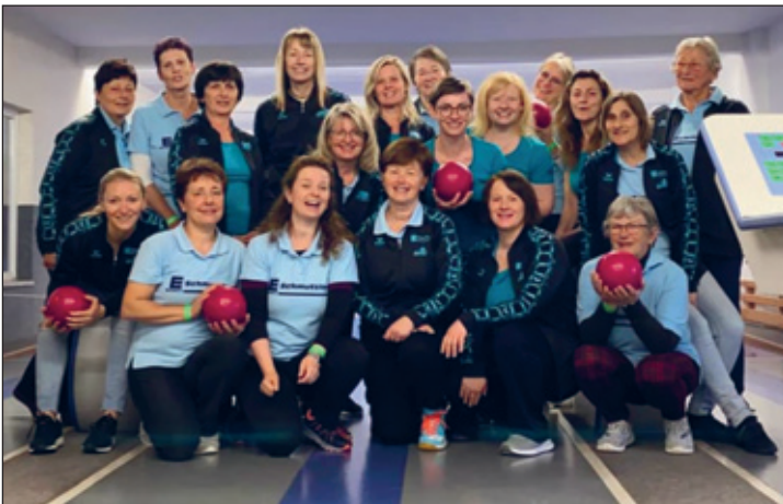
Rabenberg-Wochenende der Turnfrauen