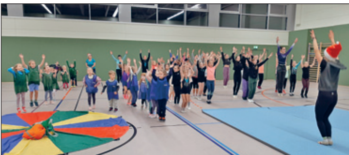
Weihnachtsturnen in der neuen Turnhalle