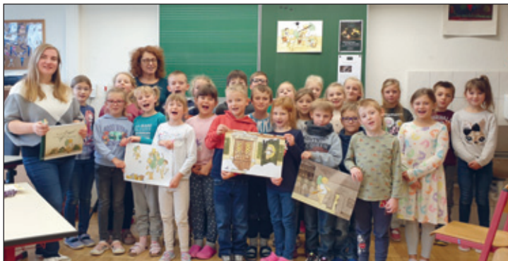
Klasse 2a und 2b

Gleichzeitig machten sich zwei Schüler der Klasse 4 auf den Weg in den Venusberger Kindergarten. Dort durften sie den Kleinen vorführen, was man alles in der Schule lernt und wie gut sie schon Vorlesen können.