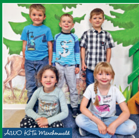
AWO Kita Märchenwald

MIT DEN ORTSTEILEN: DREBACH, VENUSBERG, SCHARFENSTEIN, GRIESSBACH, SPINNEREI, WILISCHTHAL, WILTZSCH UND IM GRUND