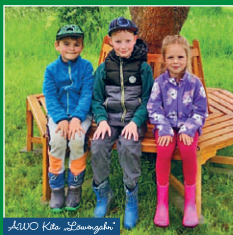
AWO Kita „Löwenzahn“

Allen Mädchen und Jungen, die am 3. August 2024 ihren Schulanfang feiern, wünschen wir alles Gute, viel Spaß beim Lernen und maximale Erfolge in der Schule.