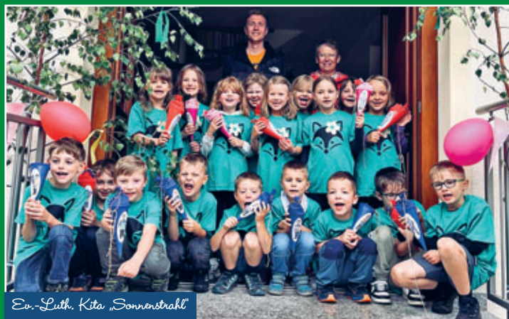
Ev.-Luth. Kita „Sonnenstrahl“