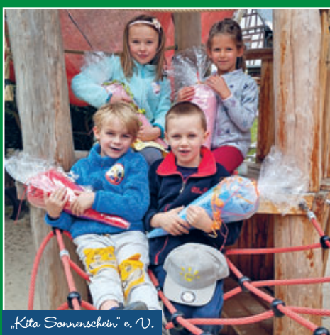
„Kita Sonnenschein“ e. V.