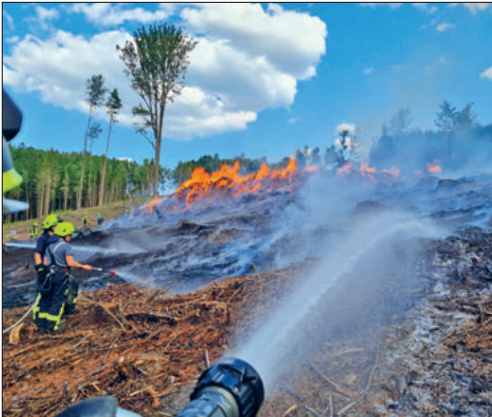
Einsatz der Ortsfeuerwehren am 07.07.2023

Anfang Juli waren unsere Ortsfeuerwehren mehrfach im Einsatz bei Waldbränden sowie bei einem Stall- und Scheunenbrand. Das zeigt uns einmal mehr, wie wichtig die Freiwilligen Feuerwehren sind und dass sich die Anschaffung des Großtanklöschfahrzeugs, welches im August 2022 in Dienst gestellt wurde, gelohnt hat. Ich bedanke mich bei unseren Kameraden, die sich bravourös geschlagen haben, im Namen aller Einwohnerinnen und Einwohner unserer Gemeinde sehr herzlich für ihren Einsatz. Gleichzeitig danke ich im Namen der Feuerwehren aber auch allen Bürgerinnen und Bürgern, die die Kameraden während der Einsätze tatkräftig unterstützt haben. In diesem Atemzug bitte ich darum, bei der momentanen Trockenheit ganz besonders sorgsam mit offenem Feuer umzugehen. Auch eine achtlos weggeworfene Zigarette kann großen Schaden anrichten.