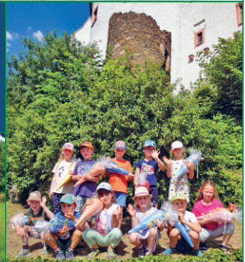
„Kita Sonnenschein“ e. V.