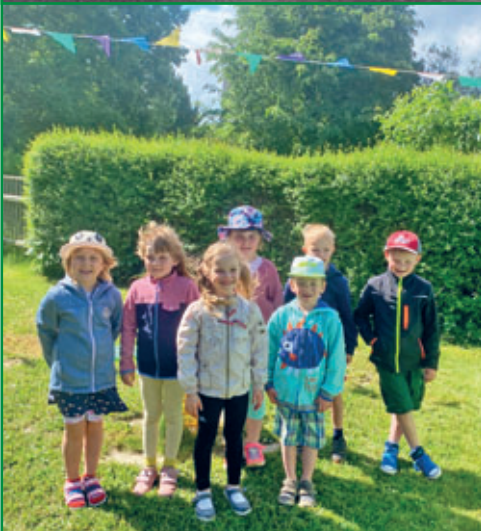
AWO Kindertagesstätte „Löwenzahn“

Allen Mädchen und Jungen, die am 19. August 2023 ihren Schulanfang feiern, wünschen wir alles Gute, viel Spaß beim Lernen und maximale Erfolge in der Schule.