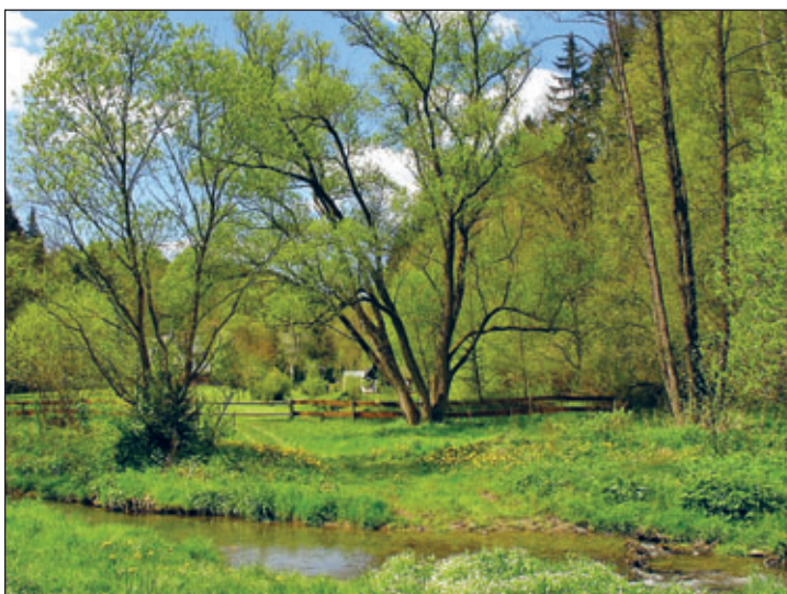
Frühling im OT Im Grund

i.A. des Vorstandes des KCD V. Trinks, VV